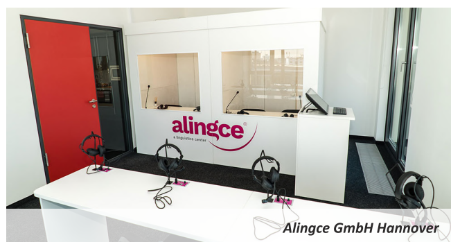
Alingce GmbH Hannover